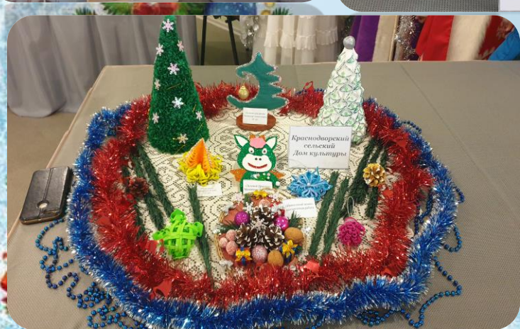
Краснодарский селский Дом культуры