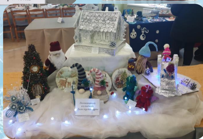
Дом культуры селского Дома культуры